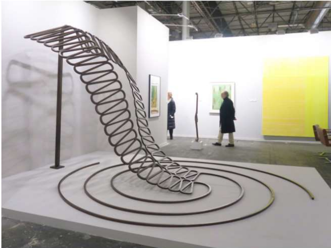
Martín Chirino. Alfaguara. 2005-2017