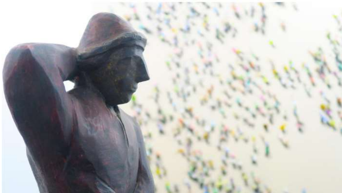
Figura ante un cuadro de Juan Genovés, en la Galería Marlborough

Tras recorrer los centenares de metros que separan la entrada a IFEMA , del Pabellón 7 , aligerados por las cintas transportadoras, uno accede a ARCO 2023 , despliega el plano y se da cuenta de que aquello parece una carta de navegación de los Estados Federados de Micronesia . ¿Donde dirigirse? Se requiere brújula.