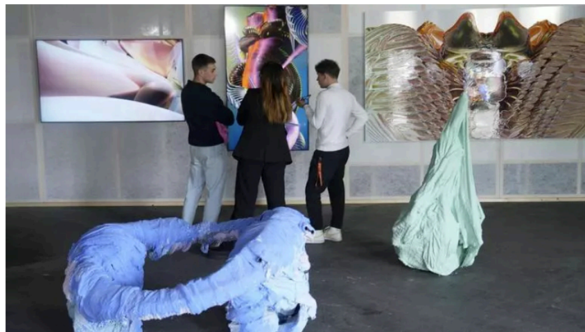
Escultures d'Elena Aitzkoa i els vídeos de Salomé Chatriot a ART Situacions III JAVIER BARBANCHO

MADRID En l'edició d'Arco que acaba aquest diumenge, el públic pot descobrir també com es forgen els artistes que en els pròxims anys trobaran a les galeries: l'associació sense ànim de lucre ART Situacions ha donat suport a cinc artistes espanyols emergents i cinc de francesos perquè produeixin una desena d'obres i ha organitzat una exposició en un espai inèdit en el context d'Arco, una sala de 500 metres quadrats ubicada entre els pavellons 7 i 9 d'Ifema. El comitè de selecció reuneix noms famosos: Chus Martínez, exconservadora en cap del Macba; Vicente Todolí, exdirector de la Tate Modern, i l'exdirectora de la col·lecció d'art contemporani de La Caixa, María de Corral, i la seva filla, Lorena Martínez de Corral.