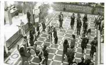
Pepe Cifuentes y Flo 6x8. Cuerpo contra capital.