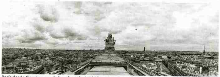
París desde Garnier, una de las obras de José Manuel Ballester.

Tuve la suerte de visitar 'Bosques de luz' prácticamente a solas y perderme por los amplios Ventanales cargados de arquitectura, naturaleza, reflejos y todo sumado, tiempo; de recrearme en sus «espacios» panorámicas urbanas, de París y Brasilia, no en vano una de las preocupaciones de José Manuel Ballester es la búsqueda de la perfecta adecuación entre temática y escala, o de introducirme de lleno en sus interiores renacentistas, alimentados por la pregnancia de sus vacíos y en los que no cabe la presencia humana porque seguramente nos distraiga del motivo principal: el espacio, y una luz que da forma al tiempo, así los verdes irrea-