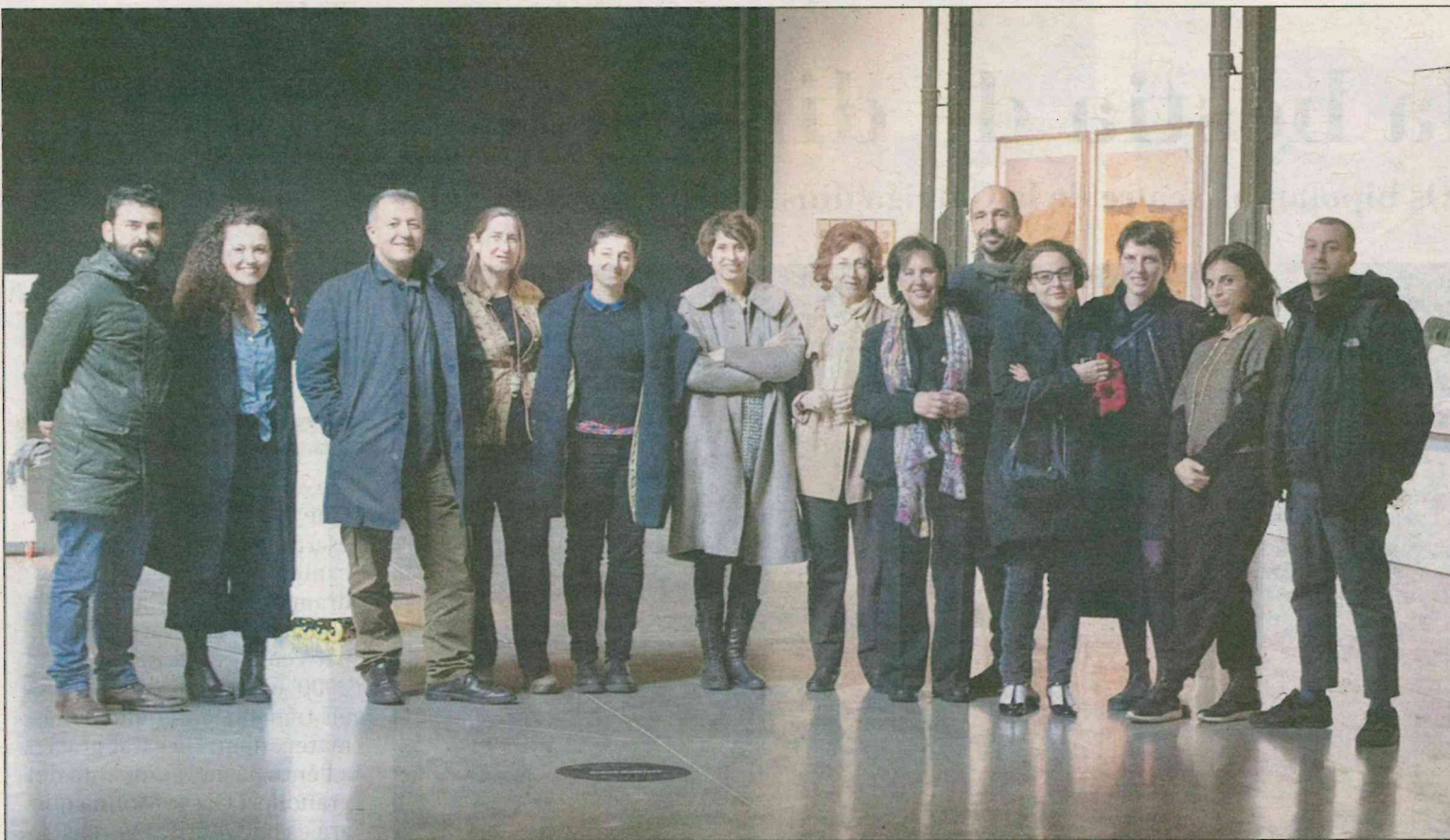
L'equip d'ART Situacions a la la Matadero, a Madrid, on l'exposició s'ha prorrogat fins al 13 de maig